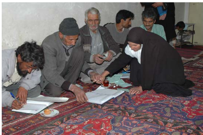
شکل ۲- تشکیل جلسات ادواری و افزایش سرمایه

یکی از ابزارهای توسعه که غالباً برای کاهش فقر، هم از جانب دولت ها و هم توسط سازمان های غیر دولتی مورد استفاده قرار می گیرد بسیج اجتماعی و اعتبارات خرد است که عبارت است از سازماندهی فقیران در گروههایی با عنوان گروه های توسعه روستایی تا بتوانند بصورت پایدار به فعالیتهای تولیدی سود آور بپردازند. اعطای وام های کوچک بدون وثیقه از محل تسهیلات اعتباری مشخص به آنان به منظور راه اندازی فعالیت های درآمدزای پایدار نیز مکمل تشکل افراد مورد نظر تلقی می شود