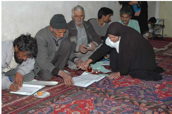
شکل ۲- تشکیل جلسات ادواری و افزایش سرمایه

یکی از ابزارهای توسعه که غالباً برای کاهش فقر، هم از جانب دولت ها و هم توسط سازمان های غیر دولتی مورد استفاده قرار می گیرد بسیج اجتماعی و اعتبارات خرد است که عبارت است از سازماندهی فقیران در گروههایی با عنوان گروه های توسعه روستایی تا بتوانند بصورت پایدار به فعالیتهای تولیدی سود آور بپردازند. اعطای وام های کوچک بدون وثیقه از محل تسهیلات اعتباری مشخص به آنان به منظور راه اندازی فعالیت های درآمدزای پایدار نیز مکمل تشکل افراد مورد نظر تلقی می شود