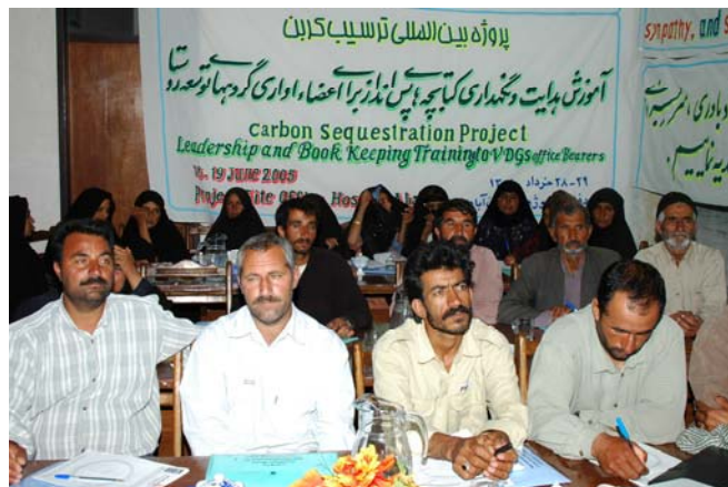
شکل ۳- آموزش رئیس و منشی گروه‌های توسعه روستائی