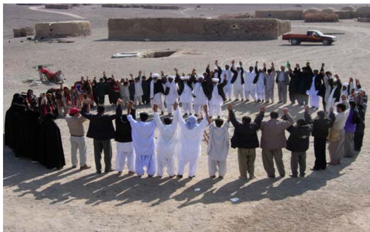
شکل ۱- بسیج جوامع محلی جهت مدیریت پایدار منابع

دادن وام به افراد نیازمند برای رفع مشکلات آنها و یا کمک به شروع فعالیت و کار، توسط افراد نیکوکار در ایران و جهان سابقه طولانی دارد. انسان از دیر باز با بیابان و پدیده های آن همراه و دست به گریبان بوده است و با دشواری ها و محدودیت های آن همزیستی داشته است. روش های مدید بین بهره برداری های انسان، قدرت تحمل اکوسیستم، تعادل برقرار بوده و پدیده بیابانزایی نمود نداشته است. با پیدایش دوران های خشکی و بروز پدیده های اقلیمی خاص از یکسو و افزایش ناگهانی جمعیت و بهره برداری های آزمندانه و نابخردانه از منابع آب و خاک، پدیده بیابانزایی آغاز گردید و مناطق با ظرفیت های بالای تولید را تحت تاثیر قرار داده است. توانمند سازی افراد محروم اساس کار پروژه می باشد همچنان که اساس کار در روند توسعه انسانی است توسعه انسانی نیز به نوبه خود اساس توسعه پایدار است برای مجریان این پروژه هیچ دستمزدی گرانمایه تر از این نسبت که خود باوری ایجاد شده در مخاطبان پروژه در همگنان آنان در نقاط دیگر کشور نیز تسریعی یابد.