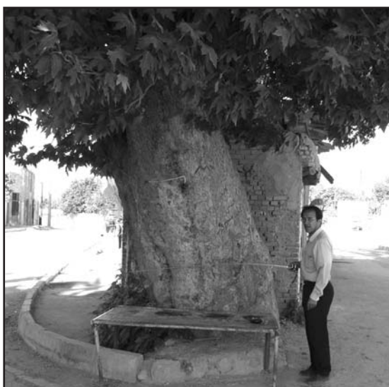
تنه چنار کهنسال دیباج