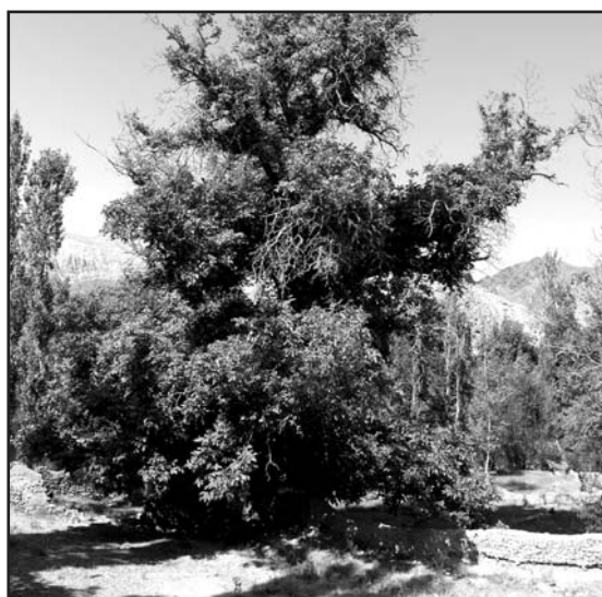
درخت کامل گردوی تویه و دروار

و از این رو بخشی از تاج آن‌ها در تماس با یکدیگرند. تاج این درخت شاداب و تنه به نسبت سالمی دارد. محیط تنه آن ۵/۹۰ متر، قطر کوچک و بزرگ برابر سینه آن ۱۷۰ × ۱۹۲ سانتی متر، ارتفاع آن ۲۷/۵ متر، طول و عرض تاج آن در شرح درخت شماره ۳ به طور مشترک اندازه‌گیری و آورده شده است.