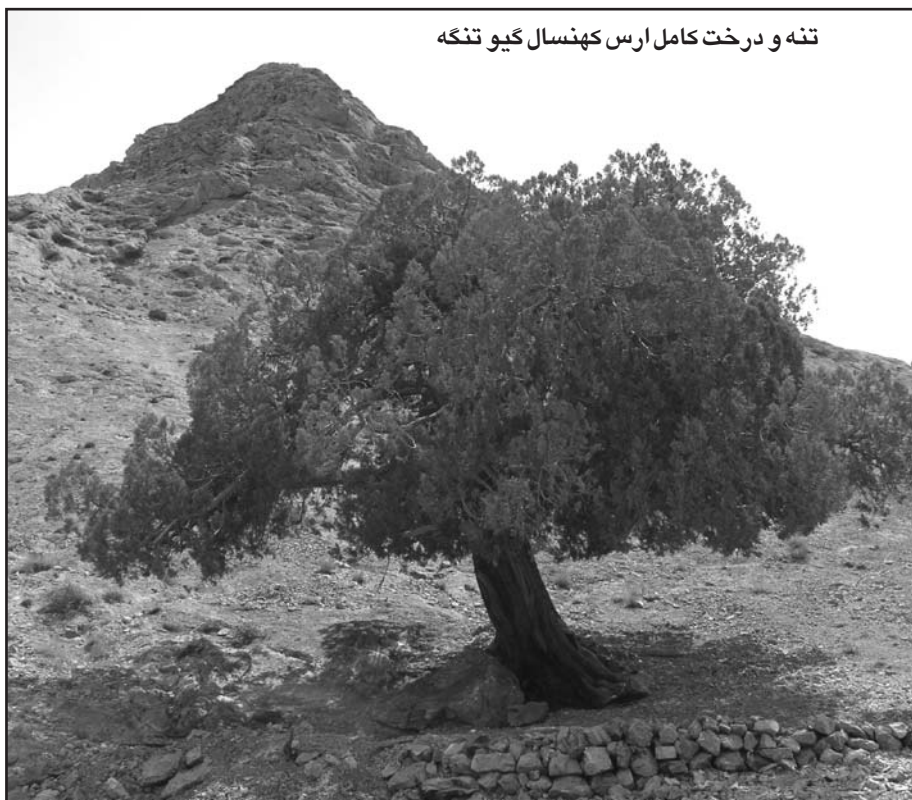
تنه و درخت کامل ارس کهنسال گیوتنگه