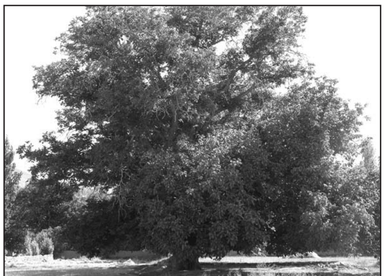
درخت کامل چنار کهنسال کهو

درخت چنار چهارم: درخت چنار چهارم در فاصله بسیار کمی از درخت سوم قرار دارد