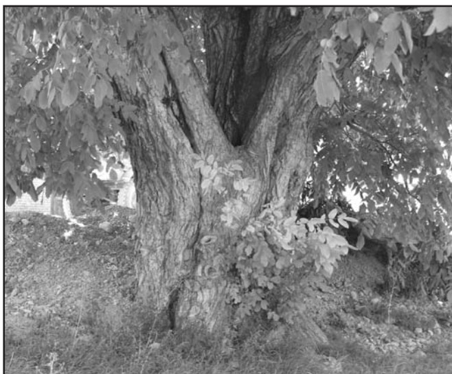
تنه گردوی کهنسال دیباج درخت سوم